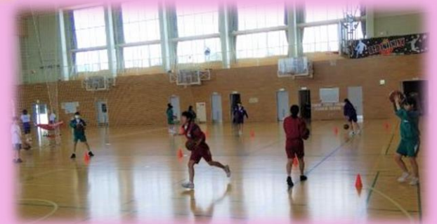
各部共通御勅使スピリッツ