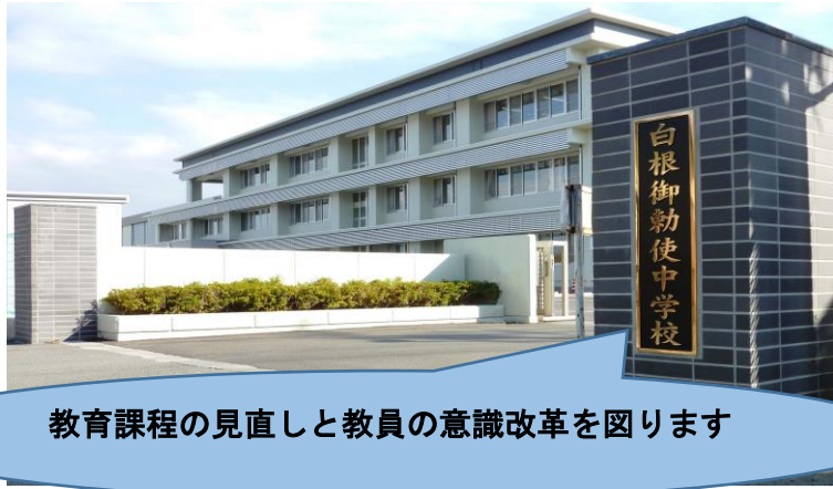
教育課程の見直しと教員の意識改革を図ります