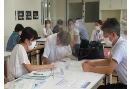
【研究・学習専門部会】