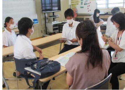
【行事・交流専門部会】