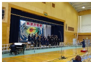
1年2組 「怪獣のバラード」