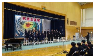
3年2組 「懐かしい未来」