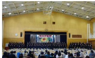
全校合唱 「大地讃頌」