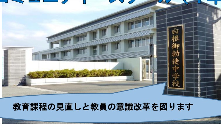
教育課程の見直しと教員の意識改革を図ります