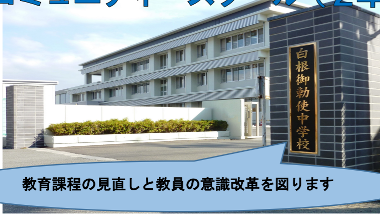
教育課程の見直しと教員の意識改革を図ります